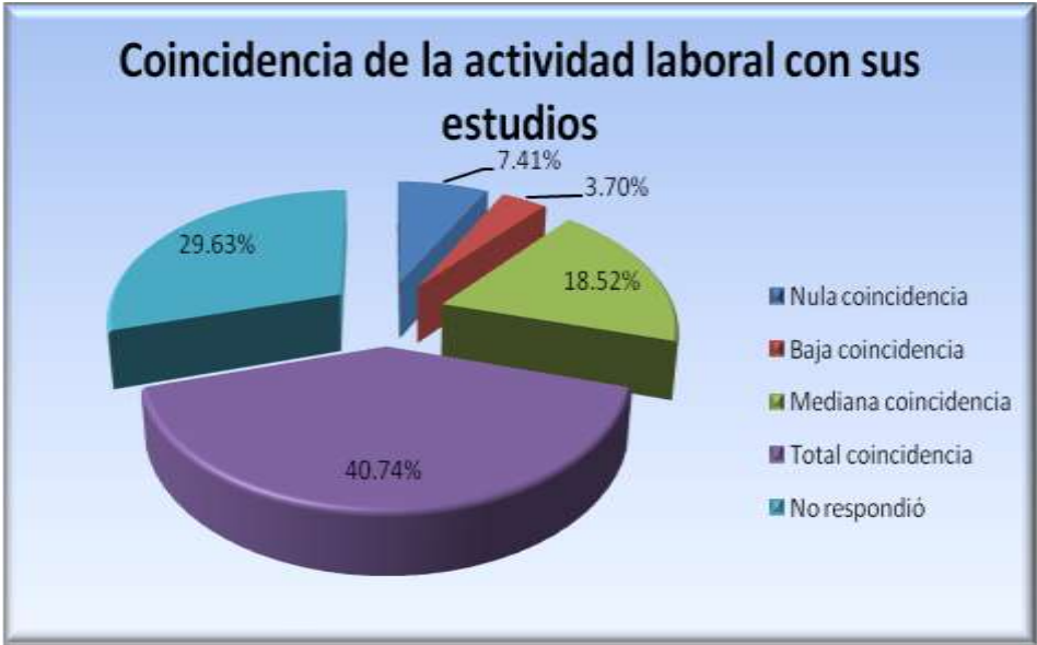
Figura 5.6.3 Coincidencia de su actividad laboral con los estudios

La coincidencia de las actividades en el empleo actual de los egresados con sus estudios es total para el 40.74%, mediana para el 18.52%, baja para el 3.7%, nula para el 7.41% y el 29.63% no respondió (figura 5.6.3).