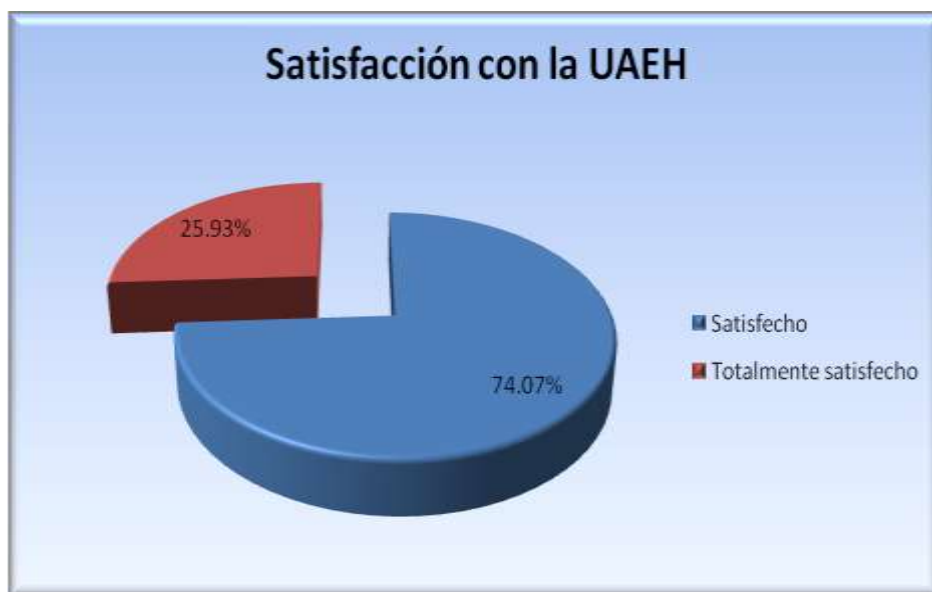
Figura 5.10.1 Satisfacción con la institución

La figura 5.10.1 muestra que el 74.07% de los egresados encuestados quedó satisfecho con la UAEH y el 25.93% quedó totalmente satisfecho.