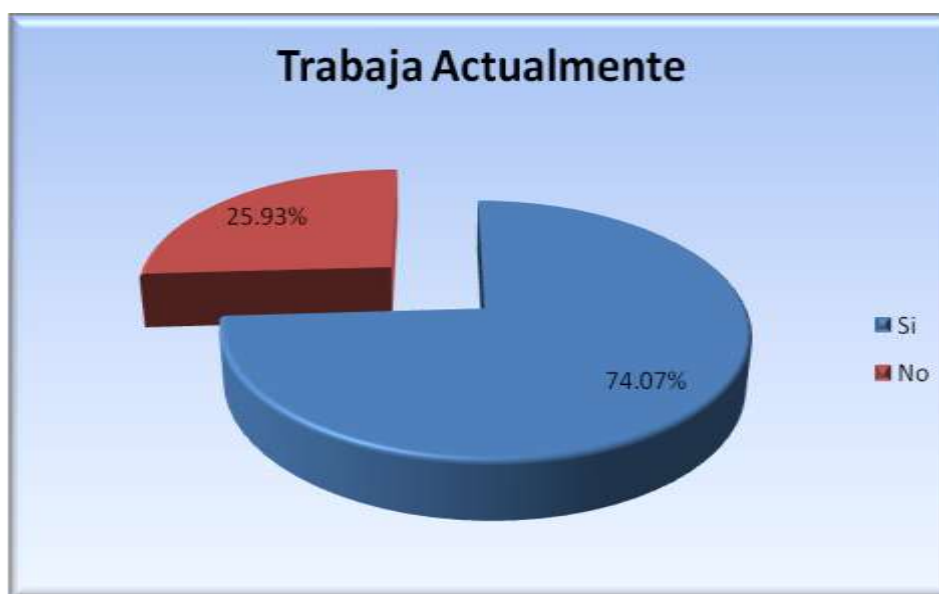
Figura 5.6.1 Trabaja actualmente

El 74.07% cuenta con trabajo actualmente y el 25.93% no trabaja (figura 5.6.1).