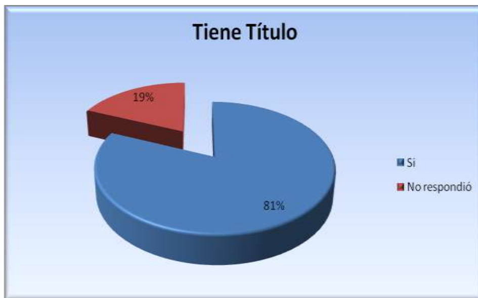
Figura 5.3.1 Título

Como se aprecia en la figura 5.3.1, respecto al índice de titulación de los egresados, el 81% ya cuenta con título, mientras que el 19% no respondió.