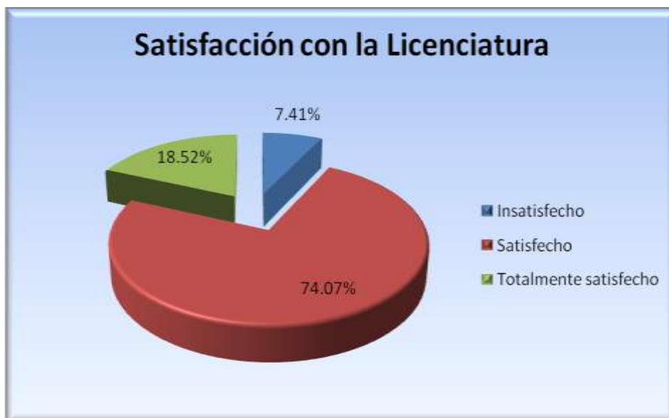
Figura 5.10.2 Satisfacción con la licenciatura

La figura 5.10.2 muestra que el 74.07% de los egresados encuestados estuvo satisfecho con la Licenciatura en Derecho de la Escuela Superior de Zimapán, el 7.41% quedó insatisfecho y el 18.52% quedó totalmente satisfecho.